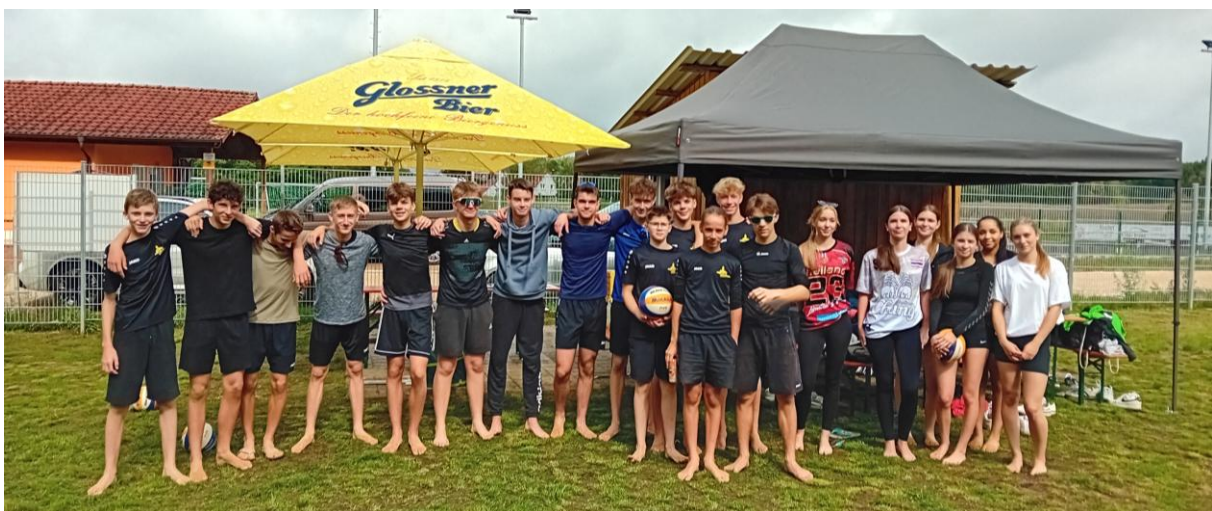
Teilnehmer VSG Rothsee Towers Jugend-Beachvolleyballturnier

Erstmals verzichtete man im Sommer auf die bisher übliche Saisonvorbereitung auf dem Beachvolleyballfeld und fokussierte sich sportlich auf das Hallenvolleyball. Trotzdem kam nebenbei auch der Sport auf dem Beachvolleyballfeld nicht zu kurz, wobei die in Allersberg ausgetragene Jugendvariante des „Closed“-Turniers mit dem Beginn der Sommerferien als Vereinsmeisterschaft mit fast einem Dutzend an teilnehmenden 2er Teams ein echtes Highlight darstellte.