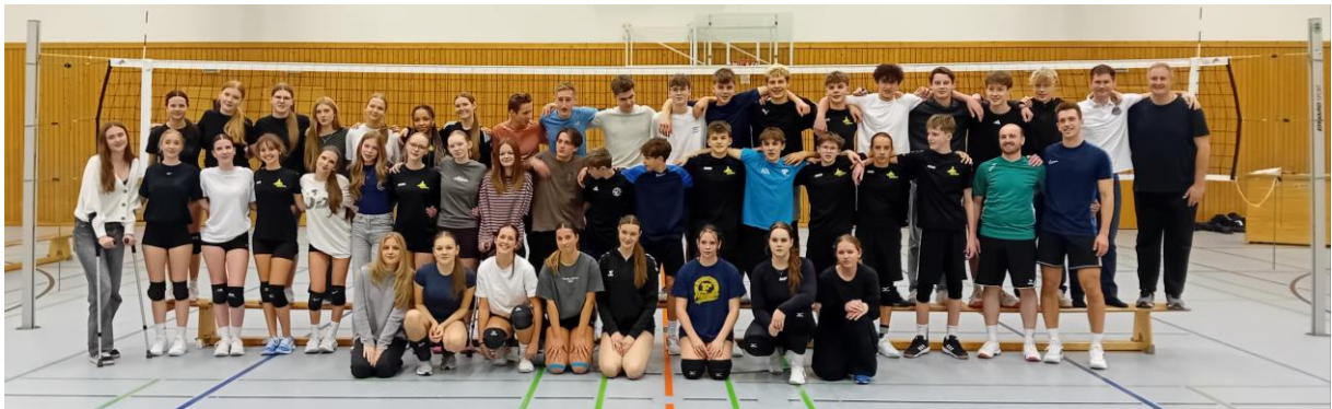
Teilnehmer VSG Rothsee Towers Jugendturnier

Mixed-Jugendturnier unter Beteiligung der Volleyball-Jugend aus Allersberg und Hilpoltstein stattfand.