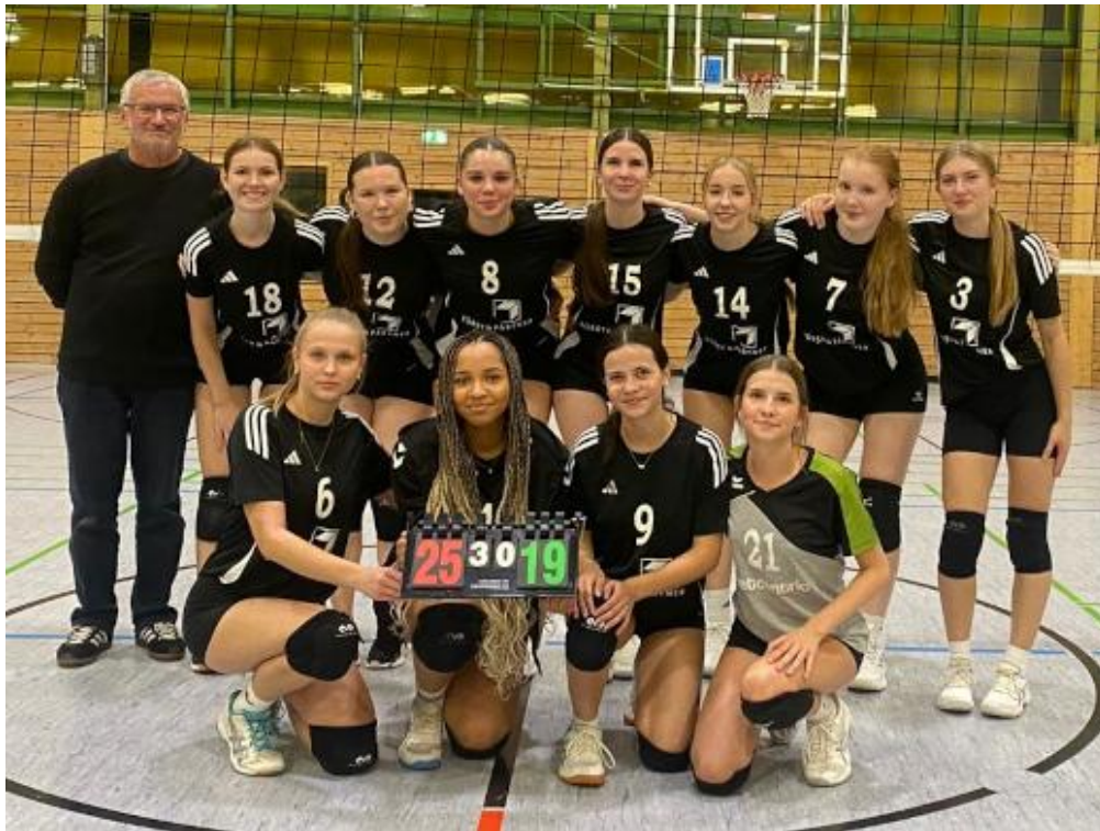
VSG Rothsee Towers 2025/2026: Damen