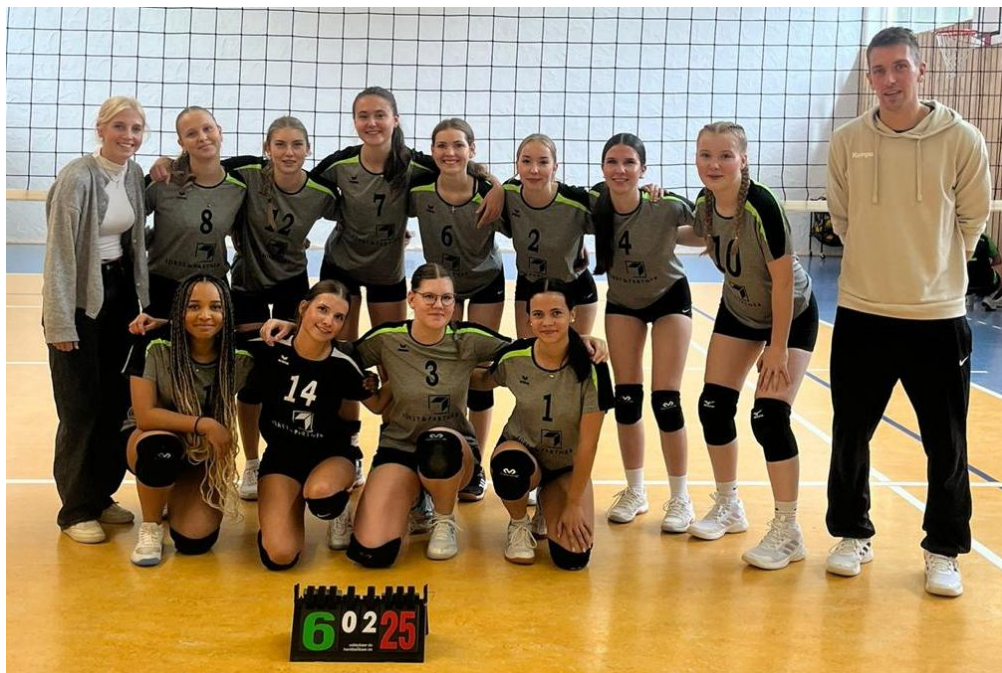
VSG Rothsee Towers 2025/2026: U20 weiblich