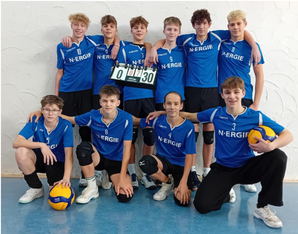
VSG Rothsee Towers 2025/2026: U18 männlich