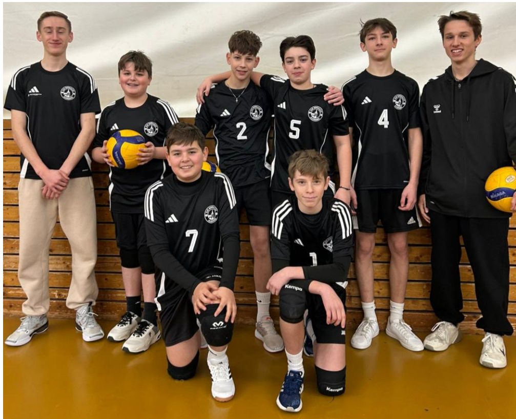
VSG Rothsee Towers 2025/2026: U15 männlich